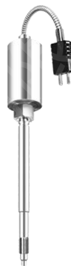
PTB113 温度压力一体变送器